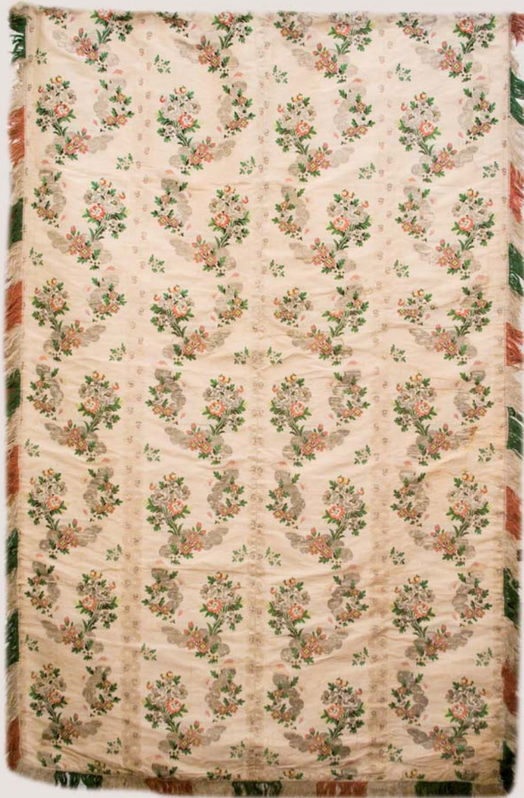
Parokhet , arazzo di copertura dell'Arca Santa, Gorizia, Italia, 1780-1790 Seta, broccato in fili di seta e d'argento Donato dalla Comunità ebraica di Gorizia Museo di Arte Ebraica Italiana U. Nahon

פרוכת, גוריצייה, איטליה, 1780-1790 משי, חוט משי, ברוקאד, מארג סטין תרומת ק"ק גוריצייה מוזיאון יהדות איטליה ע"ש א.ש.נכון