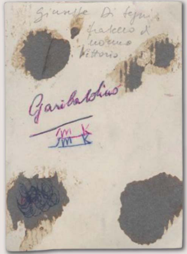
Foto di Giuseppe Di Segni in divisa da garibaldino